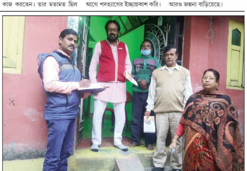
কোচবিহার উত্তর বিধানসভার অন্তর্গত এলাকায় গৃহ সম্পর্ক অভিযান।

স্বা/- (শালিনী আগরওয়াল কোম্পানির সেক্রেটারি / কমপ্লায়েন্স অফিস